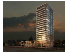
HERBERT SAMUEL ➔ Accédez à la visite du stand