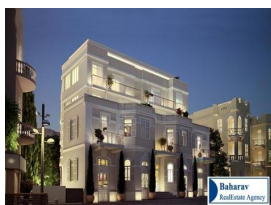
GROUPE DAREL ➔ Accédez à la visite du stand