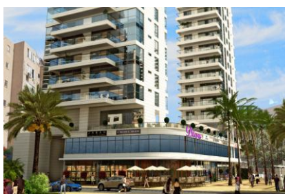
PROJET LA MER NETANYA ➔ Accédez à la visite du stand