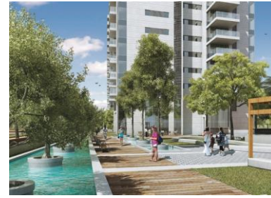
PROJET YAMIM NETANYA ➔ Accédez à la visite du stand