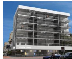
GIMEL PRESTIGE ➔ Accédez à la visite du stand