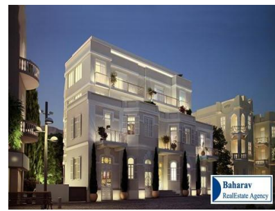
GROUPE BAHARAV JERUSALEM ➔ Accédez à la visite du stand