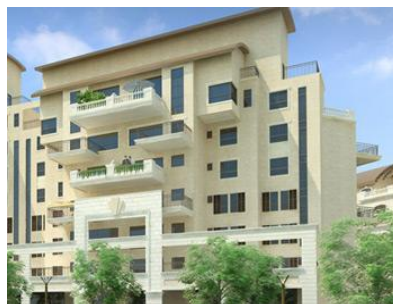
MISHKENOT JERUSALEM ➔ Accédez à la visite du stand