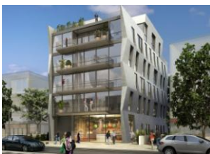
IL LIVORNO ➔ Accédez à la visite du stand